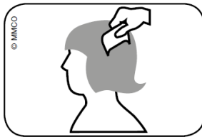
Abb. Durchkämmen des nassen Haares mit Lauskamm: vom Haaransatz bis zu den Haarspitzen